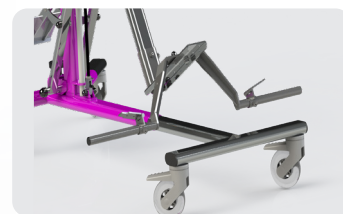
Pièces adaptées pour patient adulte: grandes roues Roller et fixations renforcées