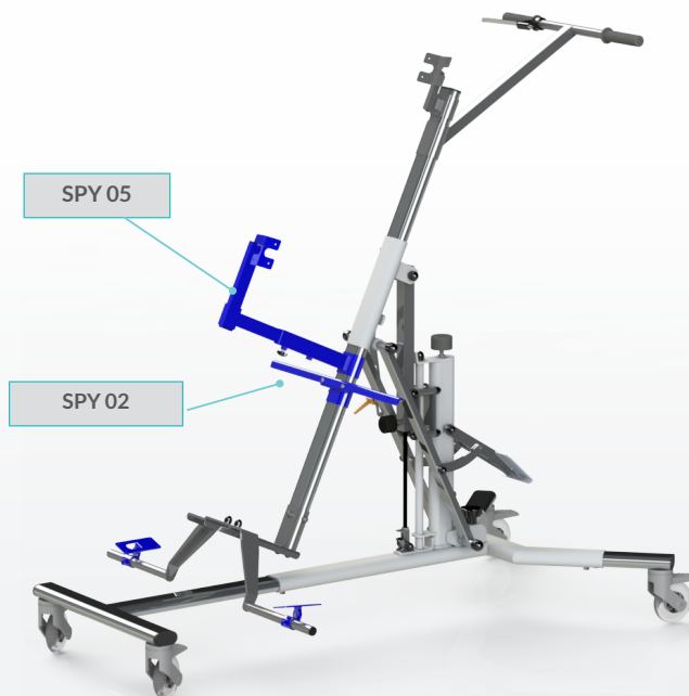
version antérieure avec options