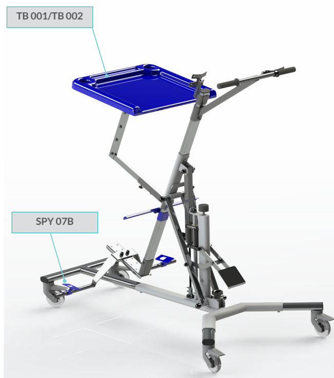
version postérieure avec options