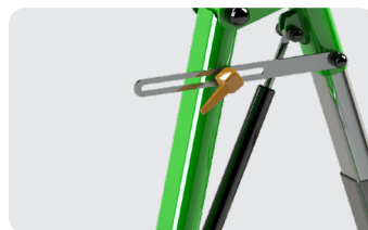
Assistance vérin : commande au pied, possibilité poignée déportée en option