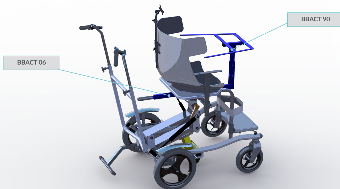
BOOBA CT avec options