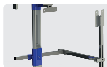
Appui dos avec système d'ouverture pour faciliter l'installation