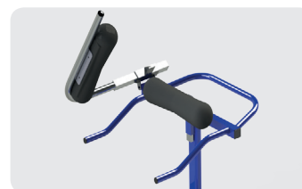
Ouverture du cadre et barres d'appuis pour aider au transfert