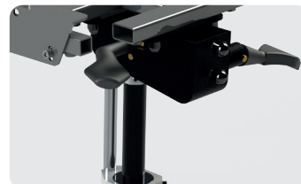
2 manettes de réglage pour la hauteur et l'inclinaison d'assise