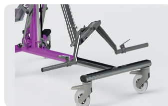
Pièces adaptées pour patient adulte: grandes roues Roller et fixations renforcées