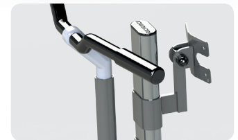
Fixation de coque sur pivot