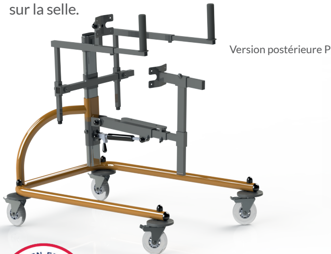
Version postérieure P