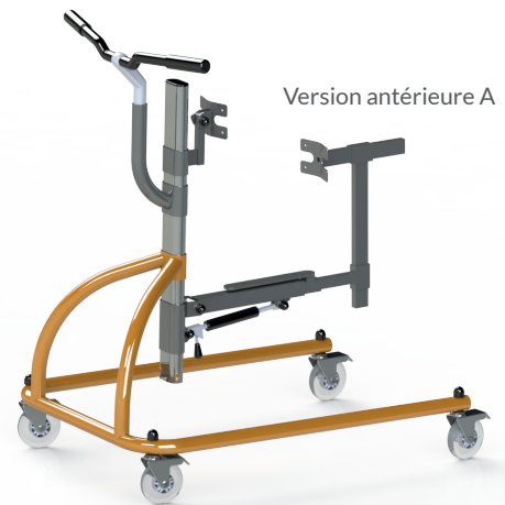
Version antérieure A