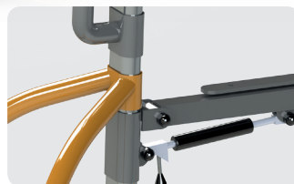
Inclinaison de l'assise par vérin Profondeur d'assise réglable