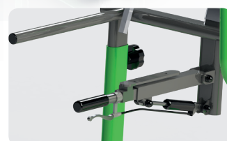
Inclinaison de l'assise par vérin Réglage en profondeur de l'assise