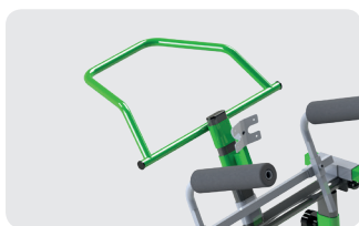
Version antérieure : Guidon de forme ergonomique