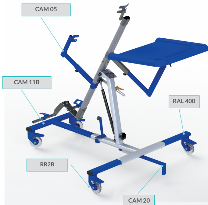
version antérieure avec options