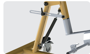
Assistance vérin : commande au pied (poignée déportée en option)