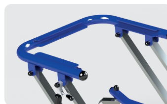
Cadre permettant d'y glisser un plateau