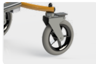
Roues extérieures permettant d'accéder à tout type de terrain