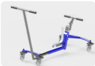
Canne de poussée plus large pour une meilleure prise en main