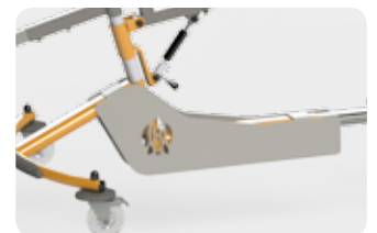
Carter en option