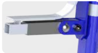
Inclinaison mécanique avec indication de réglage, disponible sur le SKUTER T1 (Préciser à la commande)