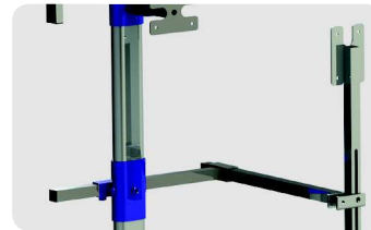
Appui dos avec système d'ouverture pour faciliter l'installation