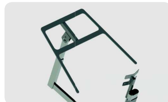
Ensemble support tablette réglable en hauteur et profondeur